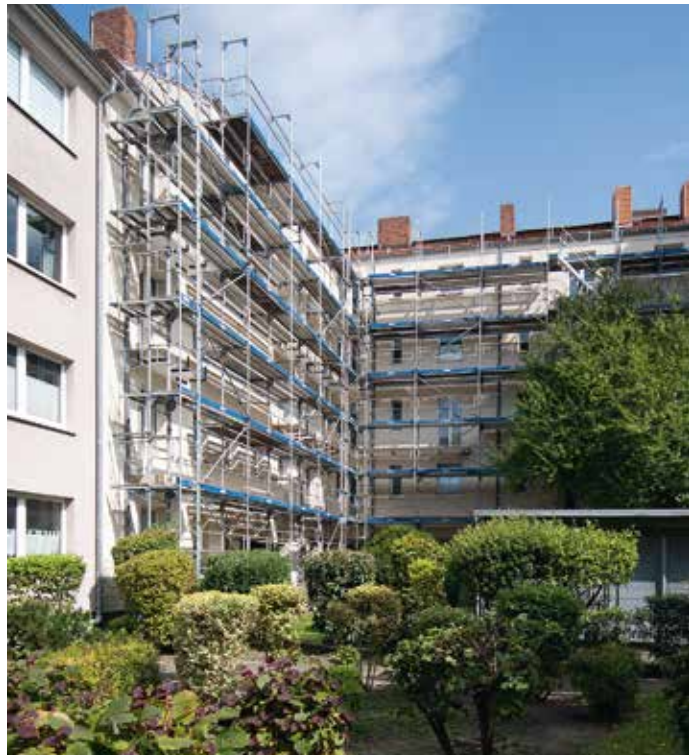
Sonnenstraße 3 und 5: Sanierung der Fassade im Innenhof